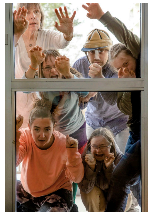
Beggar's Opera (Theaterfabrik)

Karten: Reservierung unter info@intakt-festival.at (Zahle so viel du möchtest!)