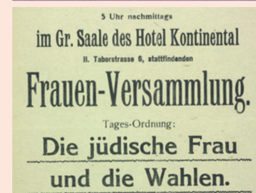
Beigepublikation zur Ausstellung auf dem Heldenplatz, Wien