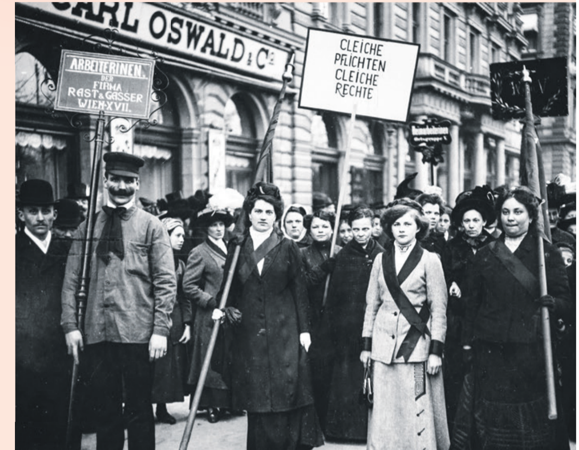
Demonstration am ersten Internationalen Frauentag Wien, 19. März 1911 Demonstration on the first International Women's Day Vienna, 19 March 1911

Constitutional democracies are based on the fundamental right of political participation of their citizens. The most important means to achieve this is the right to vote for parliament and all other organs of political representation.