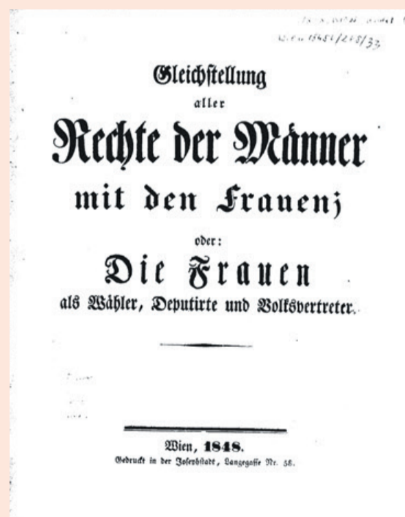
Anonyme Flugschrift 1848: Gleichstellung aller Rechte der Männer mit den Frauen

On the 21 AUGUST 1848, the first women's demonstration took place in Vienna. Female workers protested against cuts to their wages by the government. Two days later, at the so-called Battle of the Prater, the National Guard was deployed against the demonstrators. In response to the bloody violence, Karoline von Perin-Gradenstein founded the first political women's association on 28 August 1848. Its political, humane and social goal in its statutes was to achieve equal rights for women.