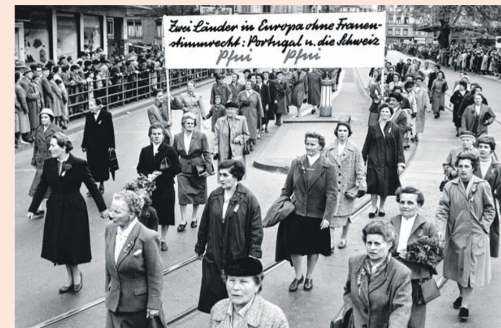
Schweizer Frauen demonstrieren 1957 für ihr Stimmrecht.