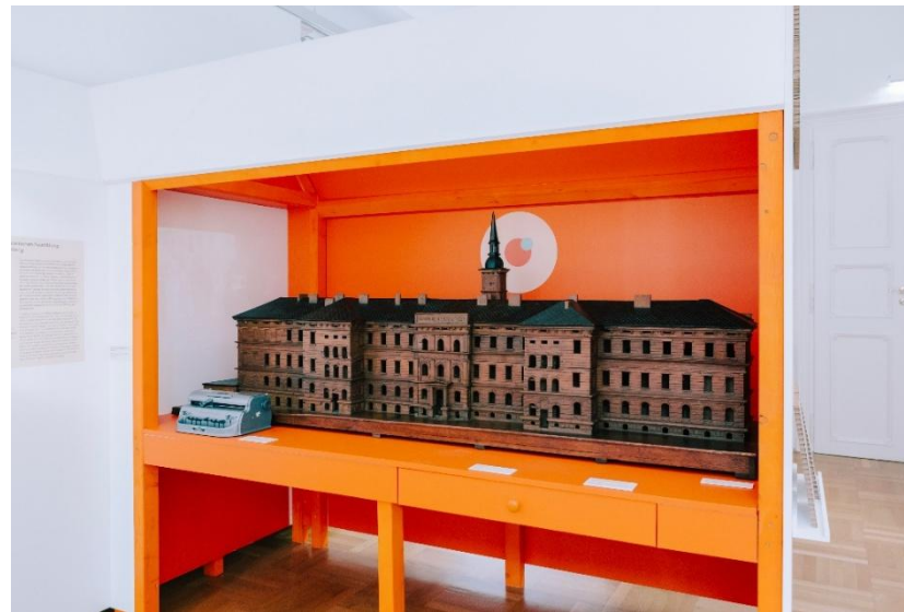
Das Bild zeigt ein Tastmodell des Odilien-Instituts. In der Lade gibt es auch ein taktiles Domino.

Es gibt ein Begleitheft in einfacher Sprache.