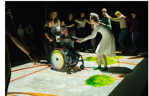
Tanztheater „Pop-Up-Garden“, Foto: © Edi Haberl

Wo: Salon Stolz, Theodor-Körner- Straße 67, Graz