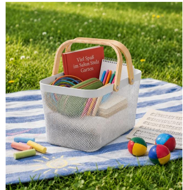
Spielzeit-Korb, Foto erstellt mit KI

Wo: Salon Stolz, Theodor-Körner-Straße 67, Graz